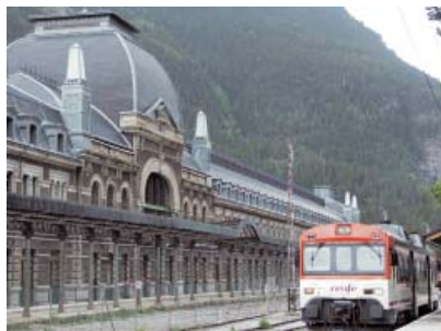
Estació de Canfranc

Per ubicar l'Estació Internacional, en la qual treballarien funcionaris dels dos països, es va triar el costat espanyol, un lloc conegut com Los Arañones. En una immensa esplanada es va acollir aquest edifici, un conjunt de vies i un poble sencer creat expressament. L'immoble, dissenyat per Fernando Ramírez de Dampierre, va destacar per l'elegància de les formes classicistes que recordaven els palaus francesos. Es volia impressionar el viatger que arribava a Espanya amb un descomunal conjunt de cinc cossos, que combinaven la pedra, el ferro, el vidre a les façanes i la pissarra a la coberta. En total 241 metres de llarg que permetien obrir 75 portes a cada costat amb vistes a sengles feixos de vies; el de l'oest per als trens espanyols i el de l'est per als del país veí, que tenen una amplada diferent. A l'interior de l'edifici s'inclouen tots els serveis necessaris per a una instal·lació d'aquell nivell: venda de bitllets, duanes, cafeteria, restaurant, hotel, biblioteca etc. Tot organitzat a partir d'un vestibul central cobert per una cúpula.