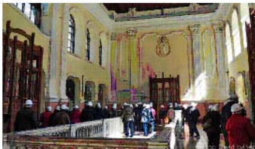
Visita guiada al vestibul de l'estació

Complementa la meua informació amb un text extret d'internet: